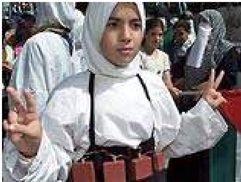
Рис. 12. Она готова стать террористкой

Непосредственную работу с потенциальным шахидом проводят «штатные» психологи террористических организаций.