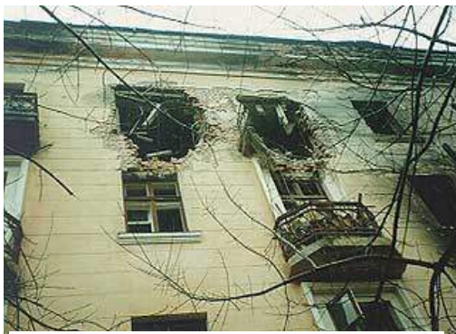
Рис. 5. После взрыва в доме

Печальная статистика жертв террористических актов не обошла и нашу страну. До распада СССР и обострения национальных конфликтов терроризм в нашей стране был весьма редким явлением. Единственный нашумевший случай в 1970-х гг. - это взрыв в вагоне московского метро в январе 1977 года, который унес более десяти жизней. Начиная с начала 1990-х гг. ситуация кардинально изменилась.