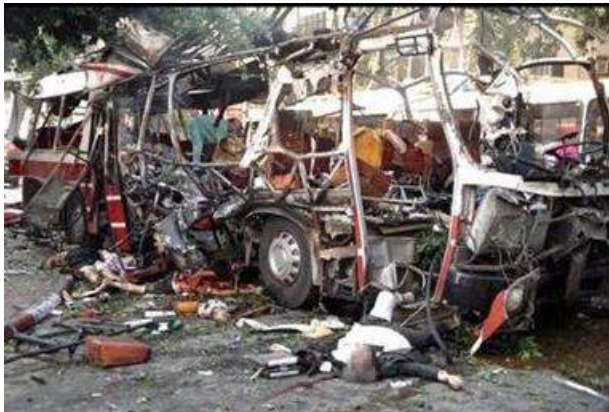
Рис. 3. Взрыв автобуса с людьми в Израиле

- политические похищения, имеющие целью добиться определенных политических условий, освобождения из тюрьмы сообщников и т.д.;