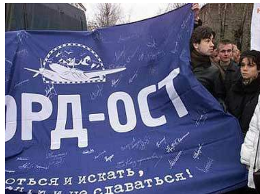
Рис. 6. Люди осуждают террористов

2004, 31 августа рядом со станцией метро «Рижская» террористка-смертница привела в