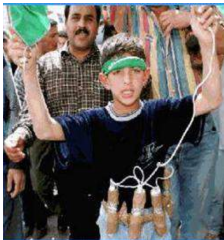
Рис. 8. Он уже готов проститься с жизнью («пушечное мясо» главарей терроризма)

б) людей неквалифицированных в профессиональном плане, но имеющих те или иные причины примкнуть к террористам (идеологические, материально-бытовые, стремление избежать уголовной ответственности за совершенные ранее преступления, отомстить за что-то властям). Эта категория представляет «пушечное мясо», рассчитанное либо на одноразовое использование, либо на непродолжительный срок пребывания в рядах террористов.