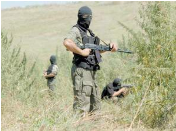
Рис. 11. Специальное подразделение проводит контртеррористическую операцию

На антитеррористические комиссии возлагаются функции координации деятельности территориальных органов исполнительной власти и органов местного самоуправления по профилактике терроризма, а также по минимизации и ликвидации последствий его проявлений. Комиссии возглавляют высшие должностные лица субъектов Российской Федерации.