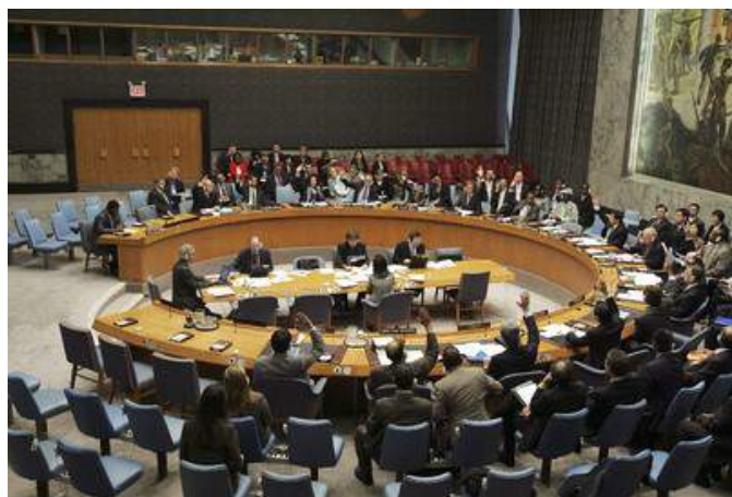
Рис. 10. Совет безопасности обсуждает проблему противодействия терроризму

Департамент по вопросам разоружения (ДВР) занимается созданием и ведением единой базы данных по биологическим инцидентам, которая содержит детальную информа-