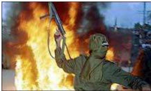
Рис. 4. Современный облик терроризма

Сегодня наблюдается резкий всплеск и качественные преобразования терроризма. Терроризм значительно расширил свою географию, охватил Латинскую Америку и Азию. Он обрел черты наступательности, высокой технической оснащенности, отличается изощренностью и жестокостью.