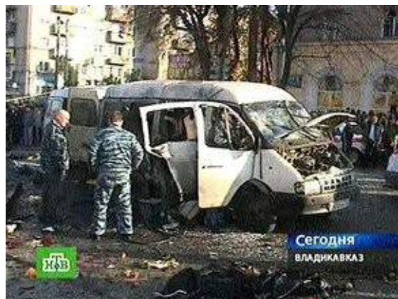
Рис. 7. Взрыв маршрутного автобуса

действие взрывное устройство мощностью до двух килограммов в тротиловом эквиваленте. 10 человек погибли, более 50-и получили ранения.