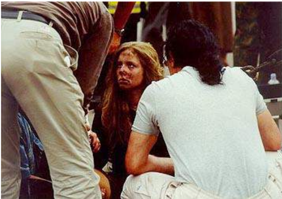
Рис. 2. Сразу после теракта

Отвечая на поставленный вопрос, необходимо подчеркнуть, что терроризм не есть что-то беспричинное или коренящееся в дефектах биологической природы человека. Это - явление, прежде всего, социальное, имеющее корни в условиях социального бытия людей. Именно здесь содержатся истоки потенциальных проблем и