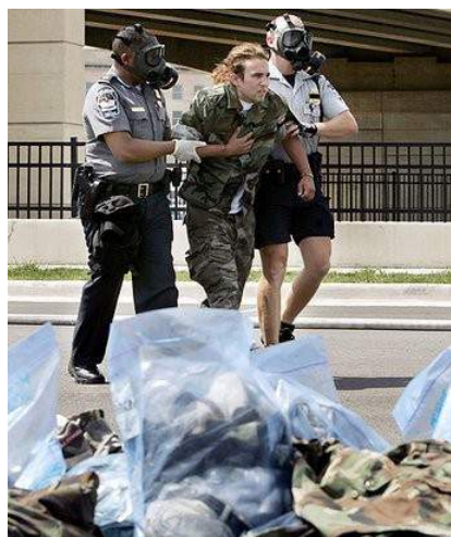
Рис. 13. Оказание помощи после взрыва

Необходимо помнить, что метро (помещения, вагоны) – это замкнутые пространства. Во-первых, здесь затруднены, а порой, невозможны свободные перемещения вследствие давки из-за паники, остановки поезда в тоннеле и т.п. Во-вторых, взрыв в замкнутом пространстве гораздо опаснее, чем на открытом воздухе, так как взрывной волне, образуемой давлением распространяющегося газа, некуда уходить, и она причиняет гораздо больше вреда, чем на открытом пространстве.